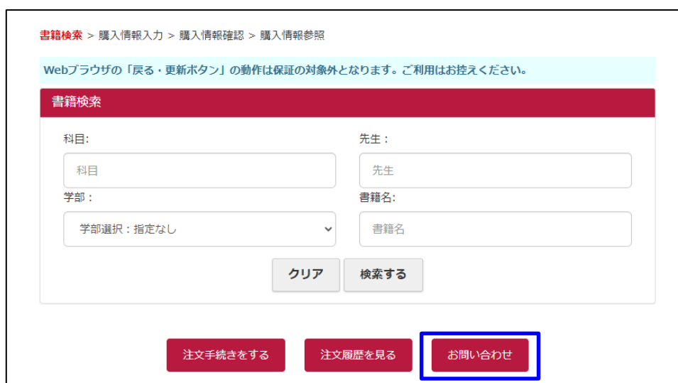
図-1 お問い合わせ画面へのボタン

「@mail.books-sanseido.co.jp」または、「@books-sanseido.co.jp」からの受信の許可をお願いします。