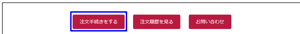
図-3 書籍の選択完了

注文対象の書籍の選択が完了したら、画面下部「注文手続きをする」をクリックします。