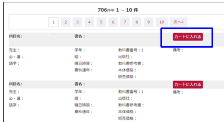
図 1-購入対象の書籍選択

検索結果の一覧から、購入対象の書籍の「カートに入れる」をクリックします。 選択済みの書籍は、「カートから削除」と表示が変わります。 「カートから削除」をクリックすると、購入対象から削除されます。