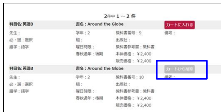
図-2 購入対象の書籍選択状態