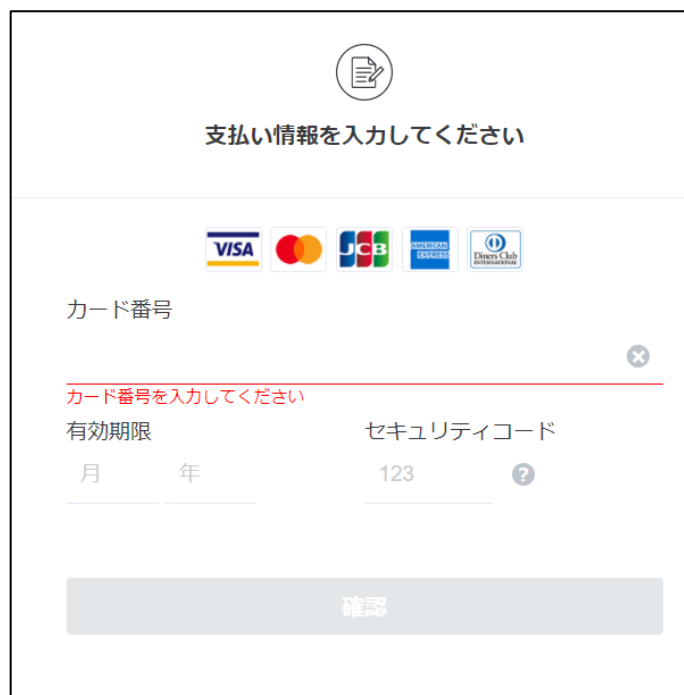
図 7 クレジットカード情報の入力

決済方法で「クレジットカード決済」を選択した場合、クレジットカード情報を入力します。